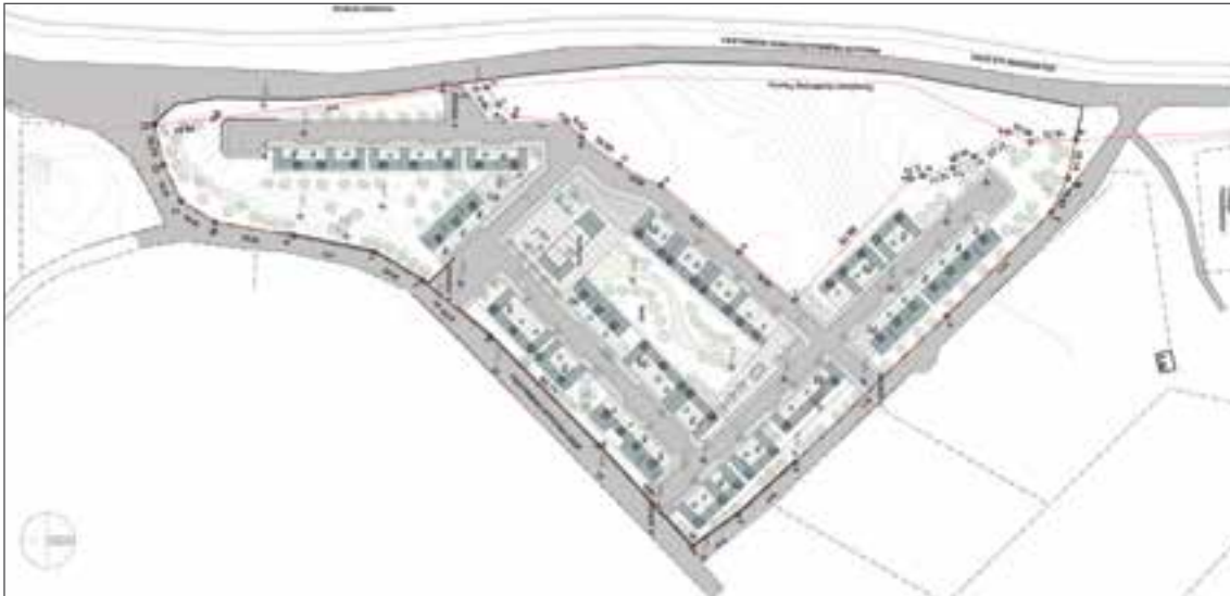
Εικόνα 2: Σχέδιο Γενικής Διάταξης (Masterplan), οικισμού Δήμου Κατερίνης

Επιπλέον, στην Περιφέρεια Στερεάς Ελλάδας οι Δήμοι Δελφών, Λαμιέων, Ιστιαίας-Αιδηψού και Θηβών και στην Περιφέρεια Αττικής ο Δήμος Χαλανδρίου είχαν δρομολογήσει τις σχετικές διαδικασίες για ανάπτυξη χώρων μετεγκατάστασης, αλλά κατά το σχεδιασμό ή και έναρξη υλοποίησης των παρεμβάσεων προέκυψαν δυσκολίες. Στην παρούσα φάση, η Ειδική Γραμματεία Κοινωνικής Ένταξης των Ρομά προχωρά σε περαιτέρω διερεύνηση για την εύρεση κατάλληλων εκτάσεων και για τους Δήμους: Σερρών, Πτολεμαΐδας, Μεσολογγίου, Δ. Αχαΐας, και Λέσβου.