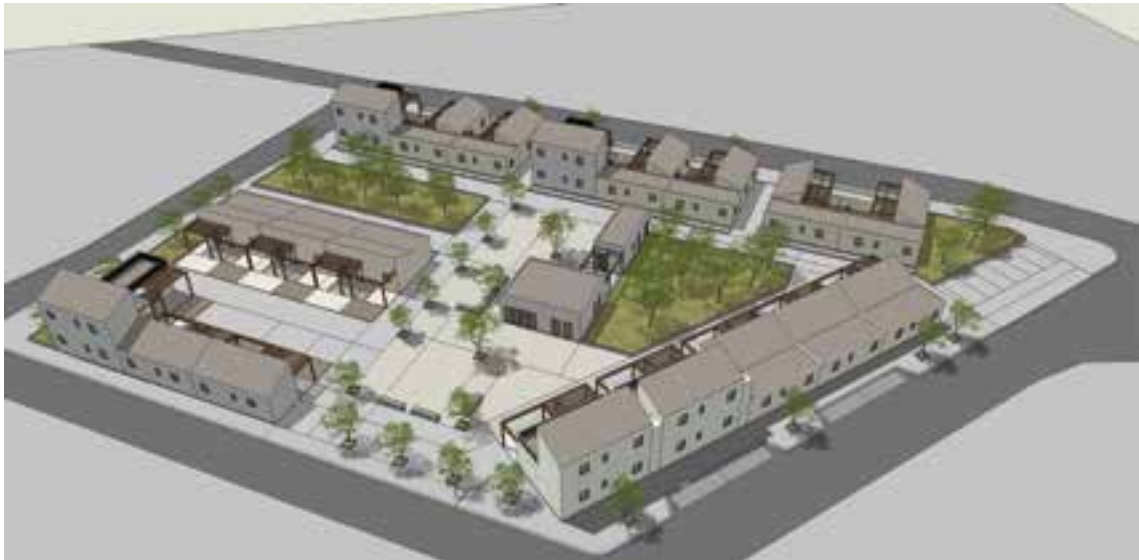
Εικόνα 1: Γενική άποψη οικισμού μετεγκατάστασης Δήμος Φαρσάλων

Σε θύλακες και καταυλισμούς όπου οι συνθήκες διαβίωσης είναι μη αποδεκτές και ο πληθυσμός διαβιεί σε παραπήγματα και χωρίς πρόσβαση σε βασικά αγαθά (ηλεκτροδότηση, νερό, αποχετευτικό σύστημα, κ.λπ.), ο δήμος δύναται μέσω του νομοθετικού πλαισίου, όπως αυτό αναφέρεται στο νόμο 4483/2017, άρθρο 159, να αναπτύξει οργανωμένο χώρο μετεγκατάστασης είτε σε νέα προτεινόμενη κατάλληλη έκταση ή εντός του υφιστάμενου καταυλισμού εφόσον τηρούνται οι απαιτούμενες προδιαγραφές.