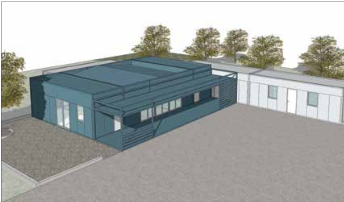
Εικόνα 4: Πρότυπη Διάταξη Πολυκέντρου

Η παρέμβαση έχει προσωρινό χαρακτήρα που στοχεύει, μέσω της βελτίωσης της ατομικής και της περιβαλλοντικής υγιεινής, στη διασφάλιση της δημόσιας υγείας και στην πρόσβαση ειδικών κοινωνικών ομάδων που ζουν σε συνθήκες κοινωνικού αποκλεισμού σε βασικά αγαθά κοινωνικής ωφέλειας. Επιπρόσθετα, σκοπός της παρέμβασης είναι η ατομική