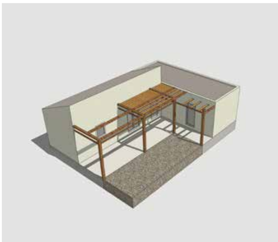
Εικόνα 3: Παράδειγμα Τύπου Κατοικίας για 3-5 ατόμων

Σε περιοχές όπου έχουν ολοκληρωθεί οι υποδομές ή βρίσκονται σε διαδικασία ολοκλήρωσης, αλλά οι συνθήκες στέγασης για ένα μέρος του πληθυσμού ή στο σύνολο του είναι ακατάλληλες υπάρχει η δυνατότητα αντικατάστασης παραπηγμάτων με οικισμούς. Τα οικόπεδα όπου θα εγκατασταθούν οι οικίσκοι δύναται να είναι ιδιόκτητα (με τίτλους κυριότητας) ή / και παραχωρημένες δημοτικές / δημόσιες εκτάσεις.