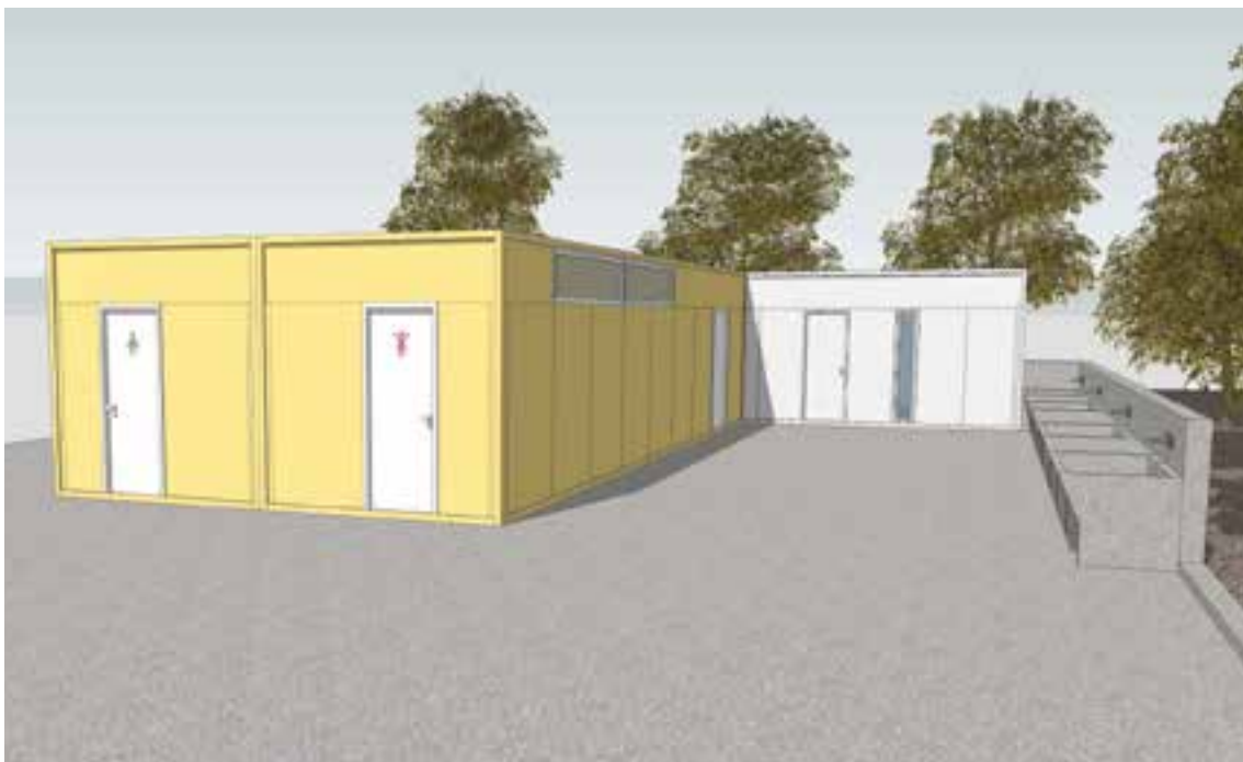
Εικόνα 5: Πρότυπη Διάταξη Δομών Υγιεινής